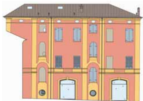
PROSPETTO OVEST (Arch. F. M. Pozzi)