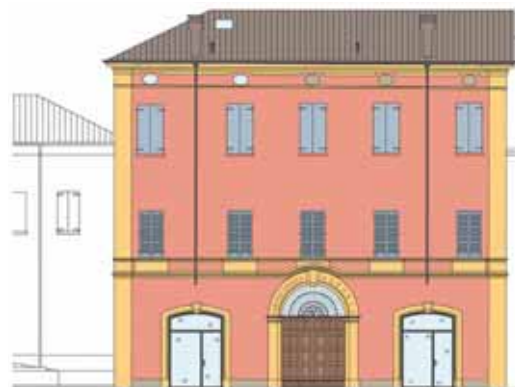
PROSPETTO SUD (Arch. F. M. Pozzi)

Dal cortile interno si accede, oltre ai locali al piano terra, al primo e al secondo piano, destinati sia a parte abitativa e residenziale del Palazzo sia a sede dell'Ente, dell'Archivio Storico e ad altri uffici.